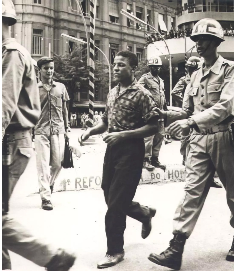
Um civil é preso por soldados da Polícia do Exército em Belo Horizonte, no dia 1º de abril de 1964.

A participação eleitoral dos comunistas, principalmente após 1947, com a cassação do registro do Partido, continha uma contradição. Mesmo entre 1950 e 1958, com o giro à esquerda do Manifesto de Agosto de 1950, o Partido não abandonou sua estratégia de uma “revolução por etapas”, defendendo a substituição do governo Dutra por um “governo democrático e popular” – mas não a revolução socialista. A tática eleitoral do Partido, de apostar nas filiações democráticas ou nos apoios ao PTB e ao PSD, começou a se desenvolver a partir do final da década e foi a marca do período entre 1958 e 1964. A arena