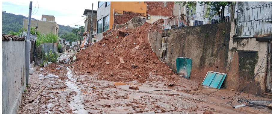
Moradias destruídas após dia de chuvas intensas em Juiz de Fora, no final de fevereiro.