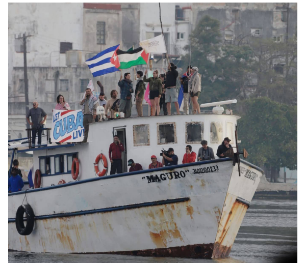
Flotilha Nossa América chega a Cuba com ajuda humanitária e painéis solares.

A solidariedade humanitária a Cuba deve ser transformada em luta política organizada contra o imperialismo estadunidense e contra o grande capital monopolista internacional.