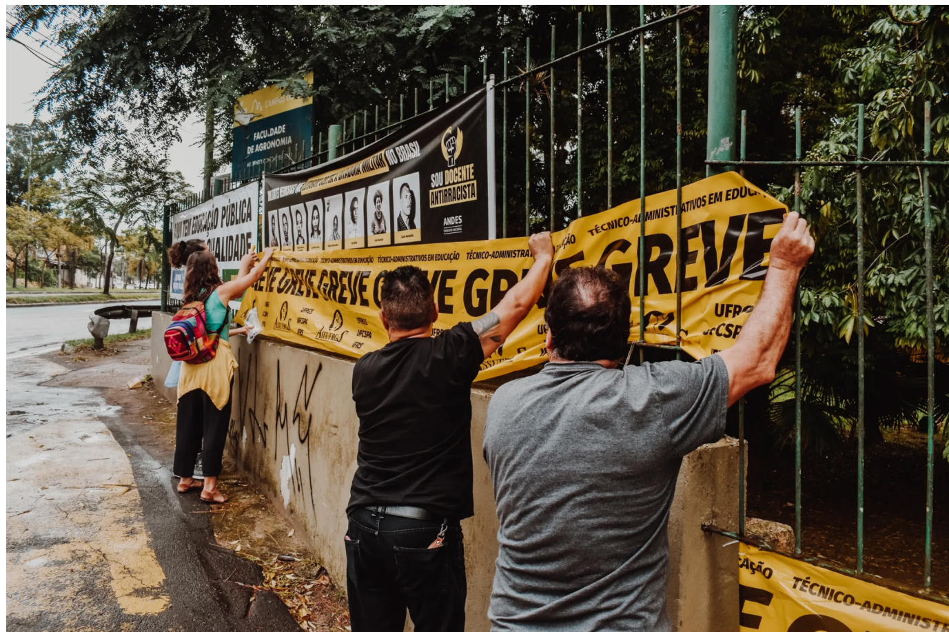
Trabalhadores em greve colocam faixa nas grades da Faculdade de Veterinária da UFRGS.

Servidores da Educação Federal deflagraram greve contra a reforma Administrativa e pela regulamentação das 30h semanais. Movimento paredista já atinge mais de 40 universidades; SINASEFE aprovou paralisação para 1º de abril, e a construção de uma greve nacional unifica a categoria pelo país.