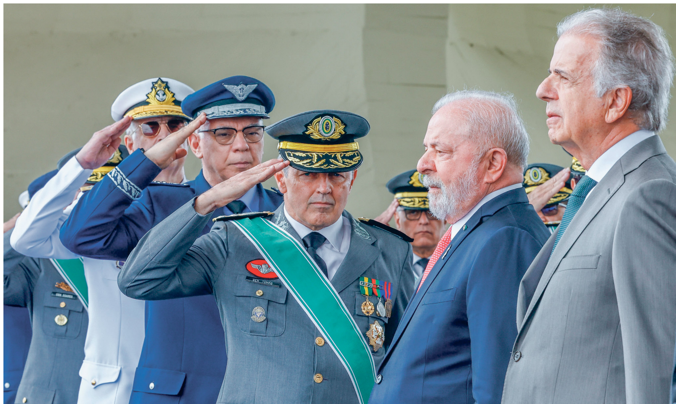
Comandantes da Marinha, da Aeronáutica e do Exército ao lado do Presidente Lula e do Ministro da Defesa, José Múcio.

Enquanto a propaganda militarista avança como uma preten-