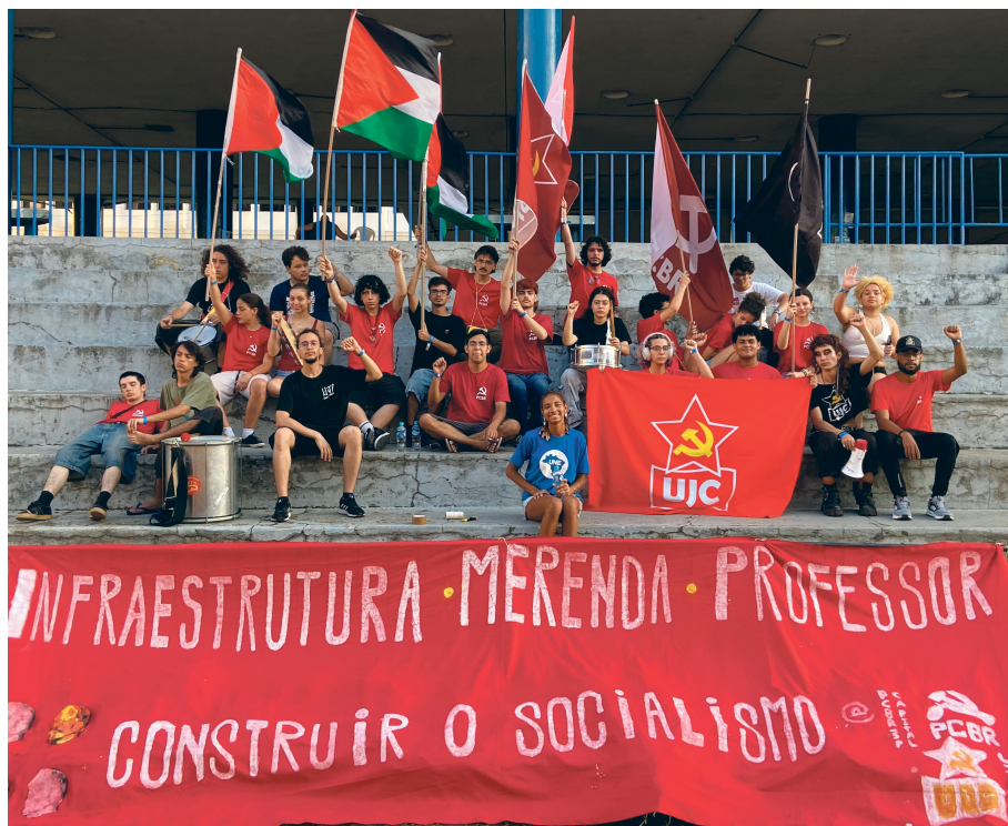
União da Juventude Comunista (UJC) no Encontro Nacional de Grêmios, em Niterói (RJ).

A educação básica no Brasil vem sofrendo com uma série de ataques que prejudicam as condições de vida e de estudo da juventude. Milhares de escolas em todo o Brasil enfrentam situações profundas de precariedade: falta climatização