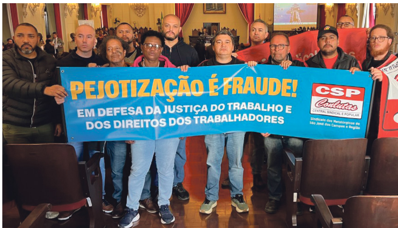
Manifestação realizada pelo Sindicato, na USP.

Portanto, a defesa do fim da escala 6x1 está diretamente ligada à necessidade de derrubar o Tema 1389. Essa luta deve estar no centro da agenda dos movimentos sociais e sindicatos, que precisam aprender com as derrotas de 2017 a evitar retrocessos na defesa dos direitos trabalhistas.