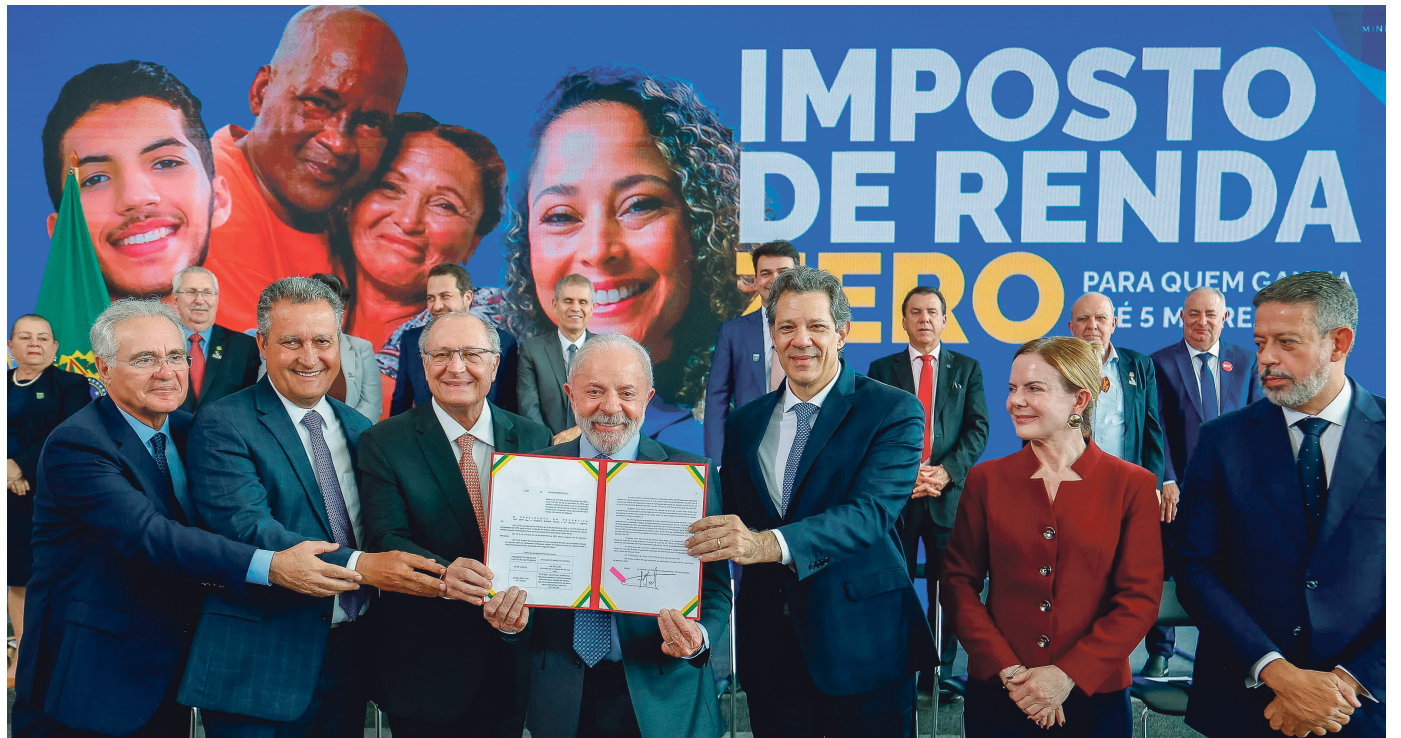
Cerimônia de sanção do Projeto de Lei nº 1.087, de 2025, que amplia a faixa de isenção e institui a tributação mínima do Imposto de Renda. Palácio do Planalto – Brasília (DF).

Importante: a ampliação da isenção para até R$5.000 só valerá a partir da declaração de 2027.