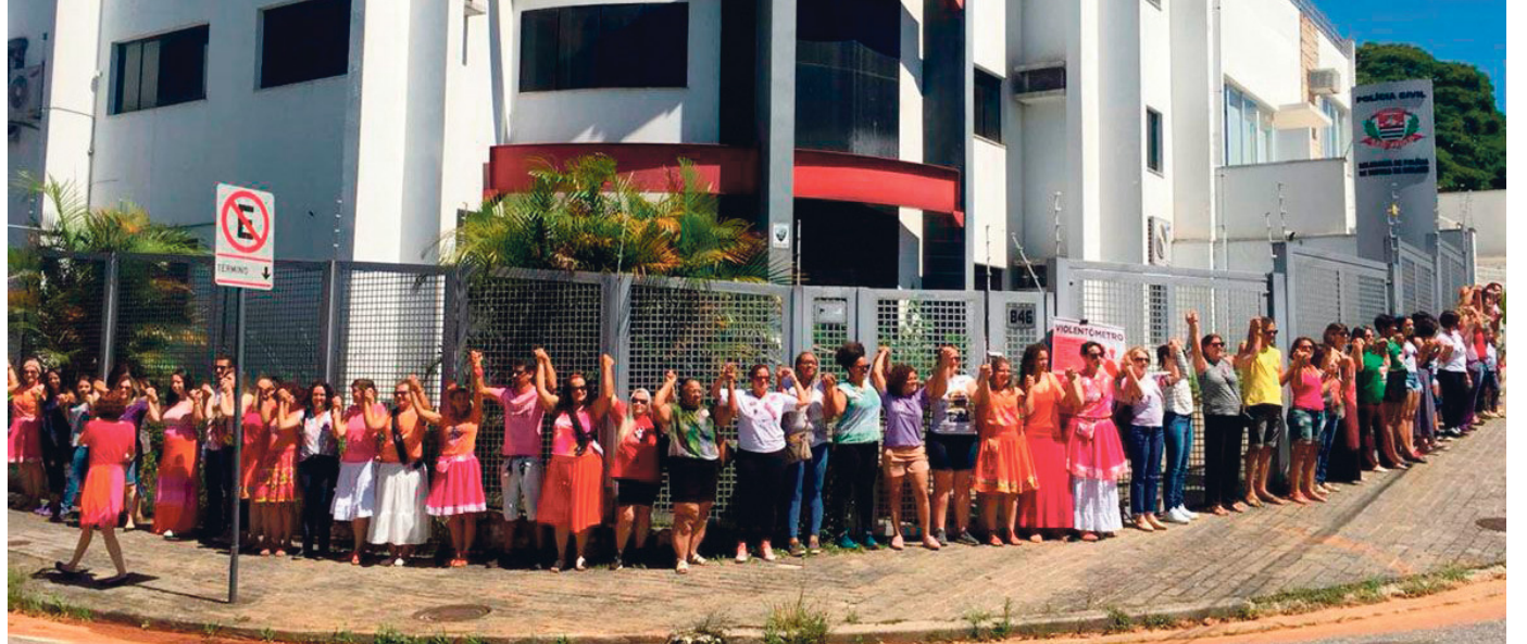
Grupo de mulheres cercou a Delegacia de Defesa da Mulher de Sorocaba, em 9 de dezembro de 2018, exigindo o funcionamento 24 horas.

Para além dos feminicídios, a violência cotidiana também avança. Levantamento do Fórum Brasileiro de Segurança Pública aponta que cerca de 21,4 milhões de brasileiras relatam ter sofrido algum tipo de agressão ao longo do ano de 2024, muitas vezes dentro de casa e por pessoas próximas.