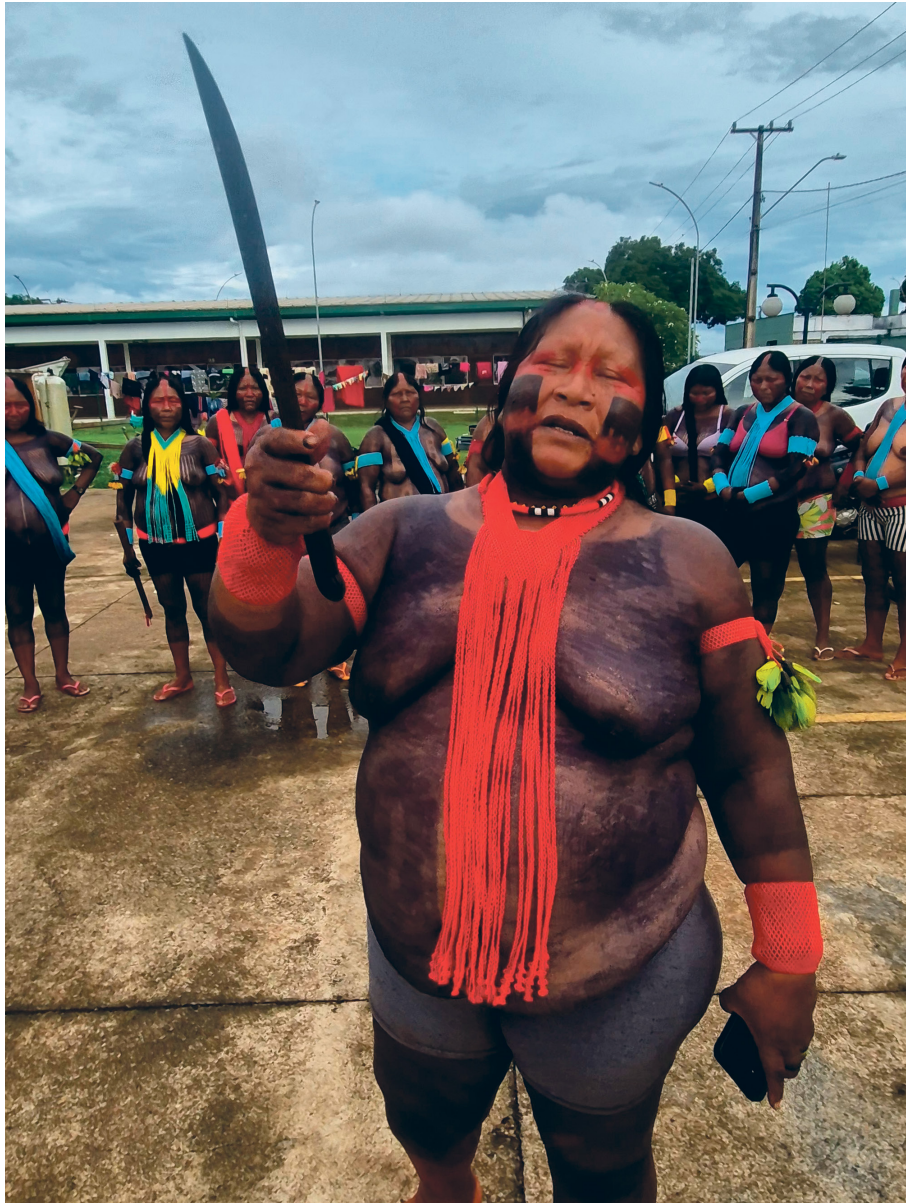
Movimento das Mulheres Indígenas do Médio Xingu fecha acesso ao aeroporto de Altamira

Ele enfatiza que as mulheres indígenas foram responsáveis por iniciar e sustentar a ocupação, além