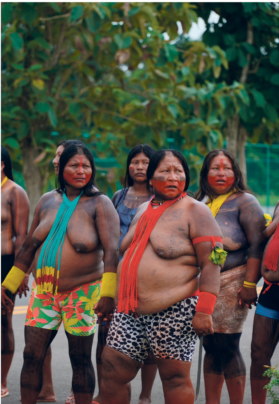
Movimento das Mulheres Indígenas do Médio Xingu fecha o acesso ao aeroporto de Altamira

Nesse mês de maio intensifica-se a disputa pelos rumos das lutas pelo fim da escala 6x1 e pela redução da jornada de trabalho. A proposta governista, ajustada para ser arrastada até as vésperas do pleito eleitoral, rebaixou a pauta apresentada pelos movimentos e partidos revolucionários que a levantaram apostando na luta de massas. A PEC do fim da escala 6x1, protocolada no Congresso pautando uma redução de jornada para 36 horas semanais na escala 4x3, foi descartada pelos partidos da frente ampla em bene-