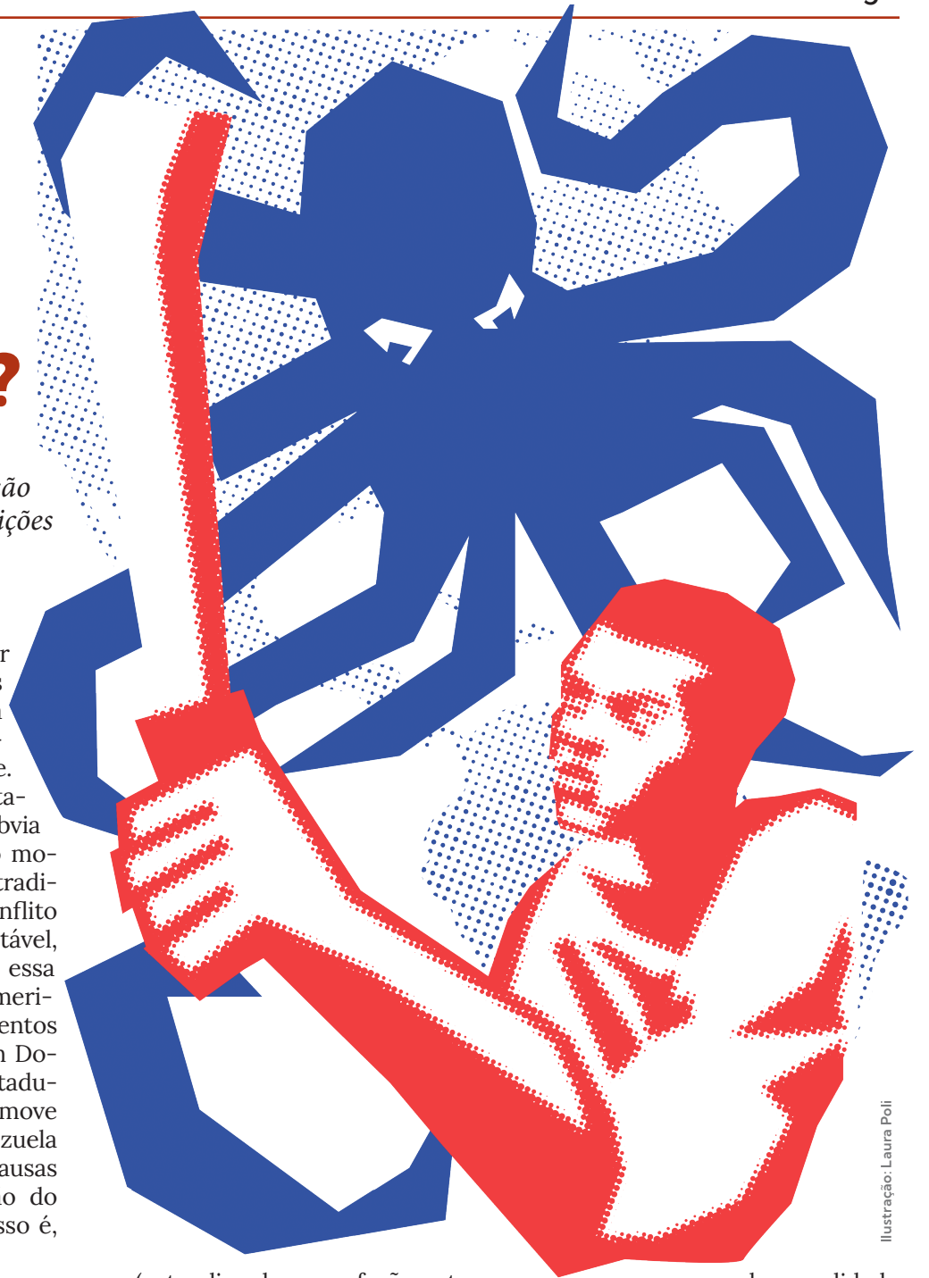
Ilustração: Laura Poli

As tarefas do proletariado revolucionário, nessa quadra histórica, não diferem em substância das tarefas colocadas para Lênin e os bolcheviques: se entendermos o imperialismo (ou seja, o capitalismo monopolista), teremos clareza para colocar a classe trabalhadora em um papel de completa independência dos interesses objetivos de qualquer potência em disputa. Não será por meio de um “pacifismo abstrato” que poderemos enfrentar a ameaça de uma guerra mundial generalizada, que parece cada vez mais próxima no horizonte, mas lutando resolutamente contra o capitalismo e tomando o poder de Estado, retirando da cadeia imperialista e, consequentemente, das disputas interimperialistas, os países, como os proletários russos, liderados pelos bolcheviques, puderam fazer na Revolução Socialista de Outubro de 1917.